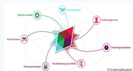
Figuur 2 Koersnaald OnderwijsKwaliteit.online

Om de State of art met deelnemende bestuurders op te bouwen, bieden we in de bijeenkomsten een inspirerende leerbron: