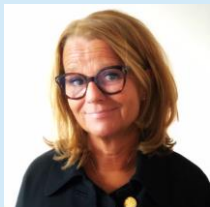
Drs. Edith van Montfort College van Bestuur, SAAM*