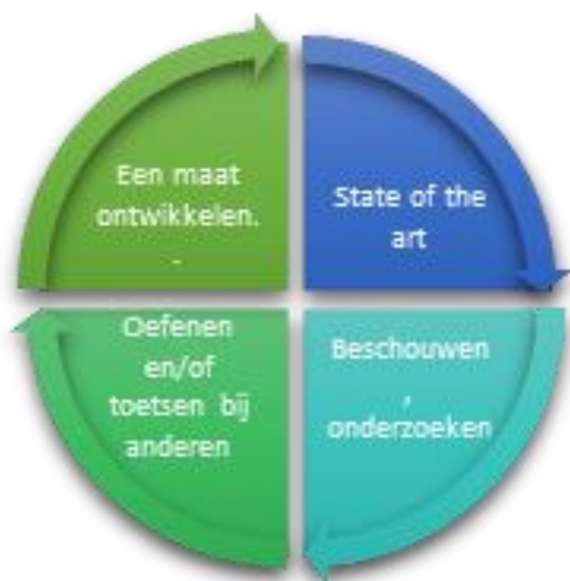
Figuur 3 Leerstadia in 2019